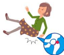
足の付け根 (大腿骨近位部)