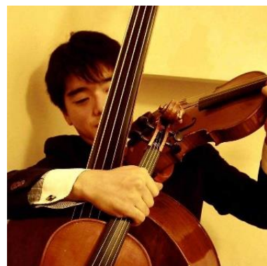
岡本直毅（おかもとなおき）

ニュージーランド出身。ピアニスト、プロデューサー、作曲家。DOMO MUSIC GROU(USA)のアーティスト。ニューエイジ音楽の先駆者、喜多朗（グラミー賞やゴールデングローブ賞を受賞）の音楽監督として知られ、グラミー賞にノミネートされた「KITARO SYMPHONY LIVE IN ISTANBUL」を含む複数のプロジェクトで活躍。喜多朗ワールドツアーメンバーでもある。