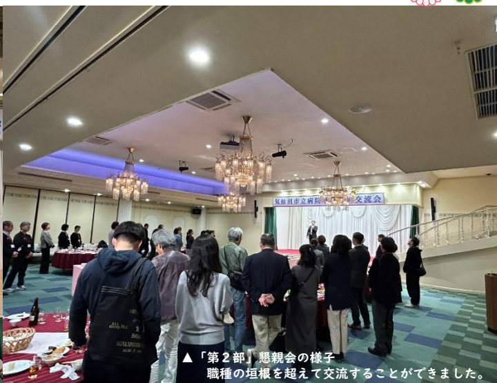
▲「第2部」懇親会の様子 職種の垣根を超えて交流することができました。