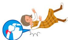
腕の付け根 (上腕骨近位端)